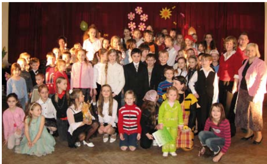
Pavākusmos aicinām draugus no citām skolām