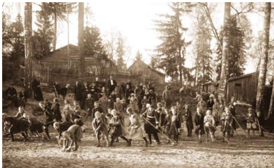
Ēalka pie skolas 1932. gadā