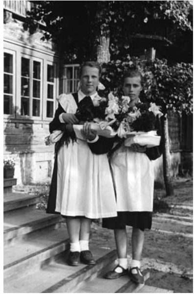
Izlaidums Ligatnes skolas 7. klase; 1957. gads