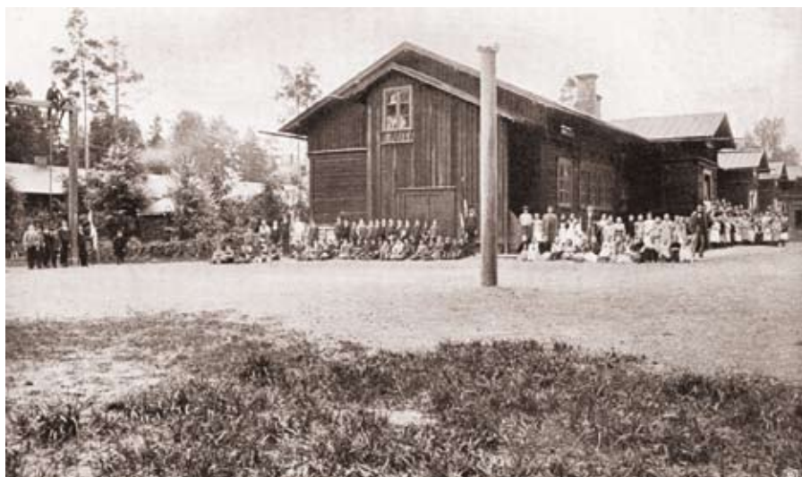
Pilsoņu iela 4, mazā skolīņa ap. 1920. g.