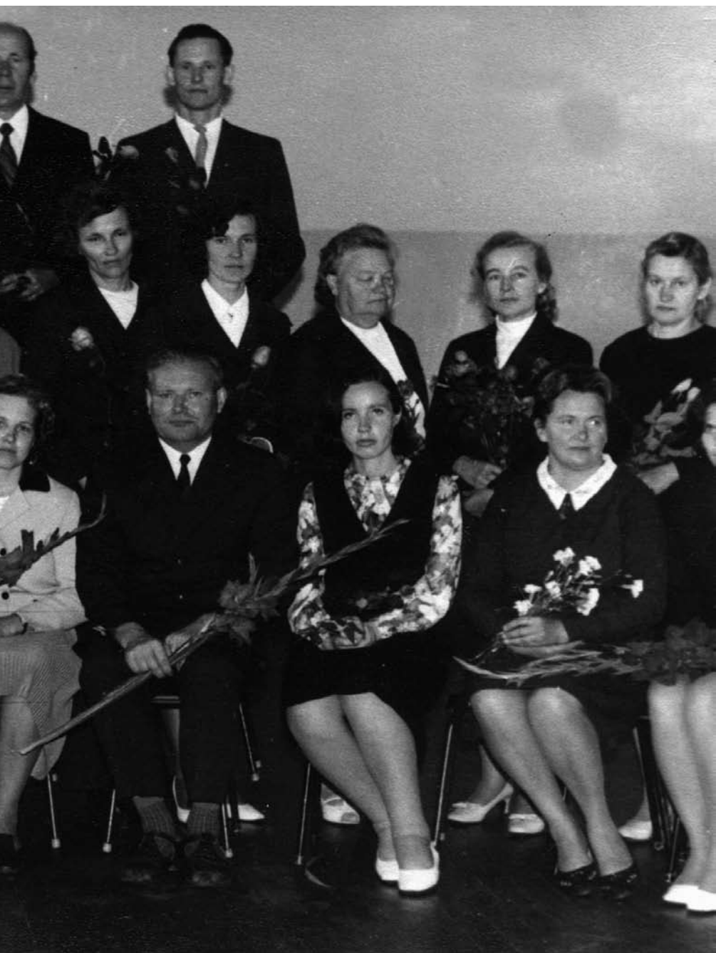
Skolotāju kolektīvs 1973. gada