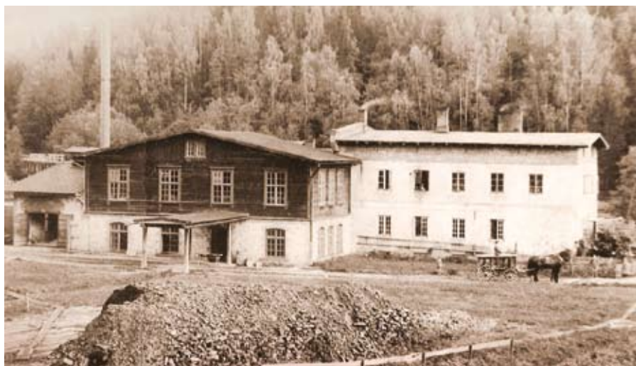
Ārnfabrikā ar 1873.