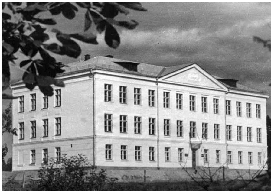
Jaunatklātā Līgatnes vidusskola 1959. gadā