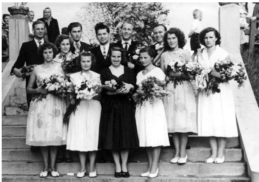
Līgatnes vakarskolas izlaidums, 1960. gads

Skolas programmās papildus vispārējās izglītības apguvei padziļinātu uzmanību pievērsa bērnu patriotiskajai audzināšanai. Bija daudz gadījumu, kad aktīva dalība pionieru un komjauniešu organizācijā un sabiedriskajā dzīvē tika vērtēta augstāk kā sasniegumi mācībās. Piemēram, 1963. gadā, izveidoja sacensību „Komunistiskā darba rezerves” nosaukuma iegūšanai, kura viens no kritērijiem bija, lai katrs klases skolēns būtu komjaunatnes biedrs. Bet šādai „politikai” bija daudzi plusi, jo skolā izveidojās vairāki