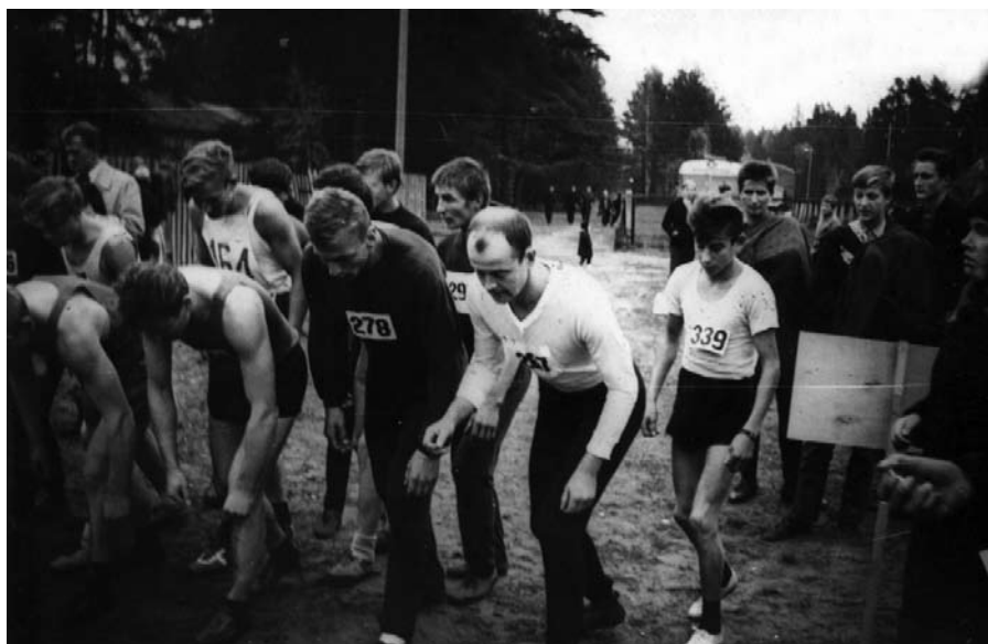
Ķross Pīpaviņos 1968 gadā

Neatņemama mācību procesa sastāvdaļa bija darbaudzināšana. Ražīga skolēnu nodarbināšana saistījās ar sekmēm mācību procesā, ko apstiprina tā laika hronika: „Analizējot un pārrunājot nesekmības cēloņus, kā vienu no galvenajiem jāatzīmē to, ka liela daļā mūsu skolas nesekmīgo skolēnu nav pieradināti sistemātiskām prasībām pret sevi. ... Tāpēc ciemata izpildu komitejas sesijā, izskatot audzināšanas jautājumu, nolēma noorganizēt vasarā darba un atpūtas nometni”. Piebilstams, ka šādas vasaras nometnes darbojās līdz pat deviņdesmito gadu sākumam, kurās katram skolēnam vajadzēja nostrādāt zināmu daudzumu darba stundu. Pret šādu darbu bija dažāda attieksme, bet reizēm šīs nometnes tiešām bija interesantas un jaukas, ja netika aizmirsta „atpūtas”.