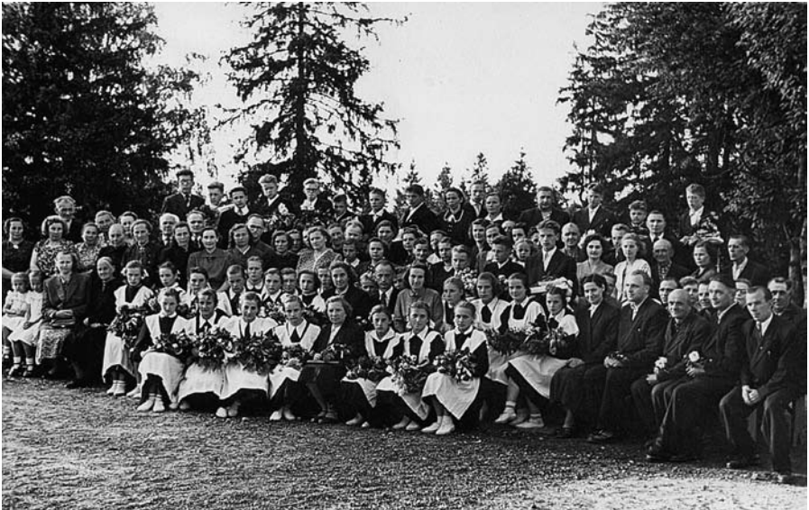
Ligatnes skolas izlaidums, 1958. gads