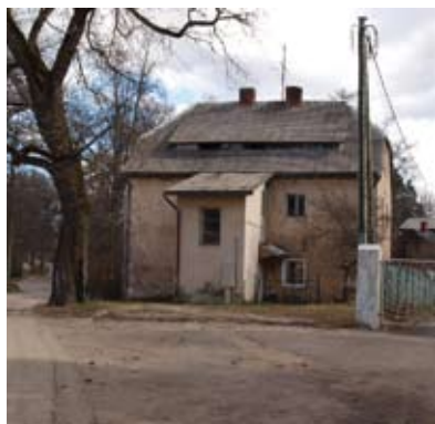
Pirmā skola Gaujas ielā 2, no 1858. gada