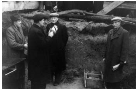
Skolas pamatakmens likšanas svinības