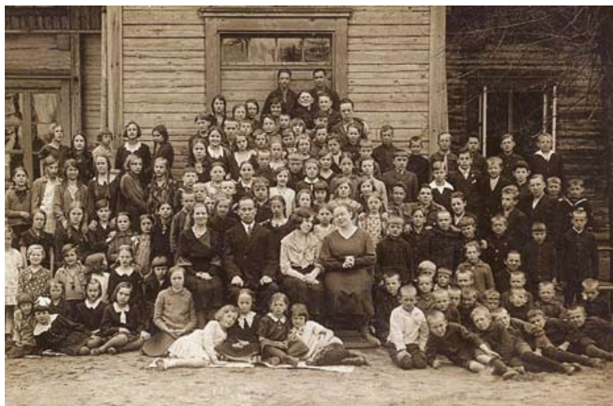
Līgatnes skola, 1932. - 33. māc. gads