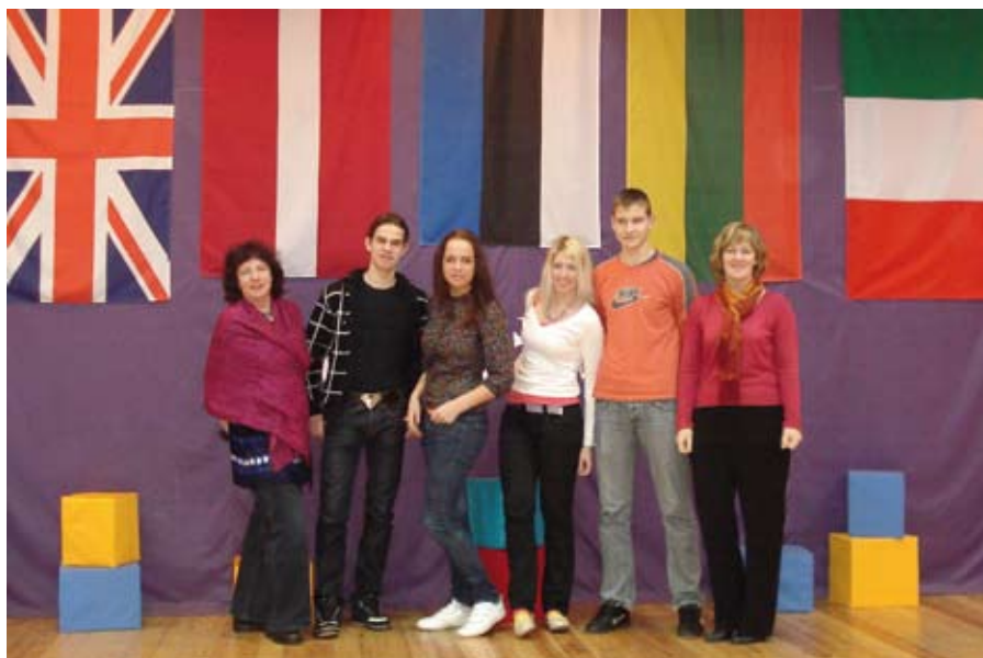
Satiba starptautiskajos projektos, ļauj labāk iepazīt pasauli