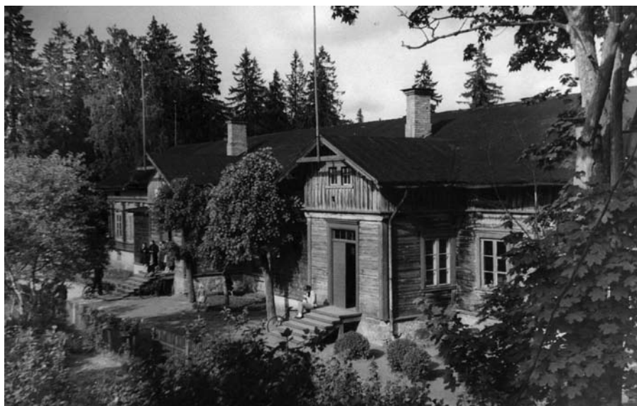
Mazā skolīņa 50—tie gadi