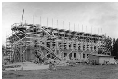
Skolas celtniecība 1955. gadā