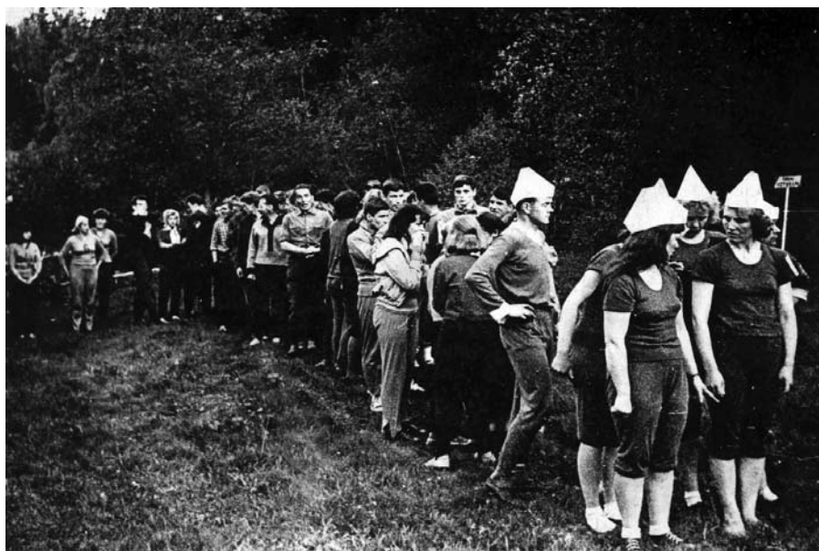
1966. gads pirmāis tūristu validojums Līgatne pie skolas

60 – tajos gados lielā cieņā bija daiļrunātāju konkursi. Līgatnieši guva atzinības gan rajona, gan republikas konkursos. Notika dažādas oktobrēnu, pionieru un komjauniešu skates – konkursi. Dominējošās tēmas bija uzticība V.I.Ļeņina novēlējumiem un komunisma gaišās rītdienas celtniecība.