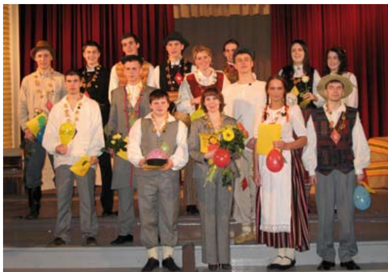
Savus svētkus veidojam paši... Zētonu vakars 2009. gada