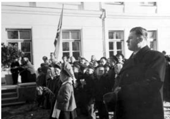
Līgatnes skolas atklāšana, priešsēdētājs izglītības ministrs N. Lāmsvans, 1959. gads