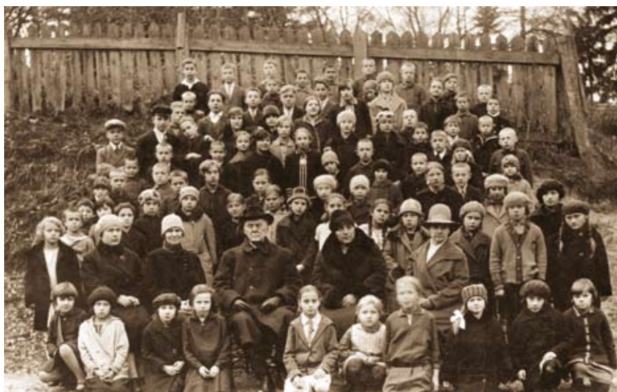
Skolas kolektīvs pie skolīņas Pilsonei ielā 4, 17.02.1929. gads