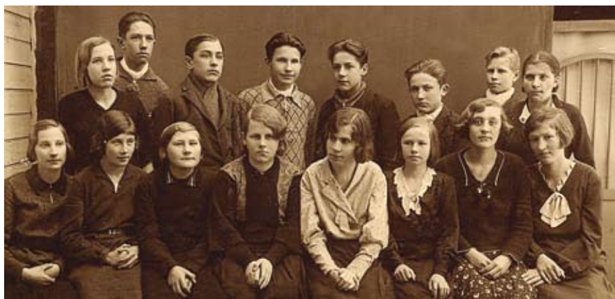
Līgatnes skolas audzēkņi, 1933. gads