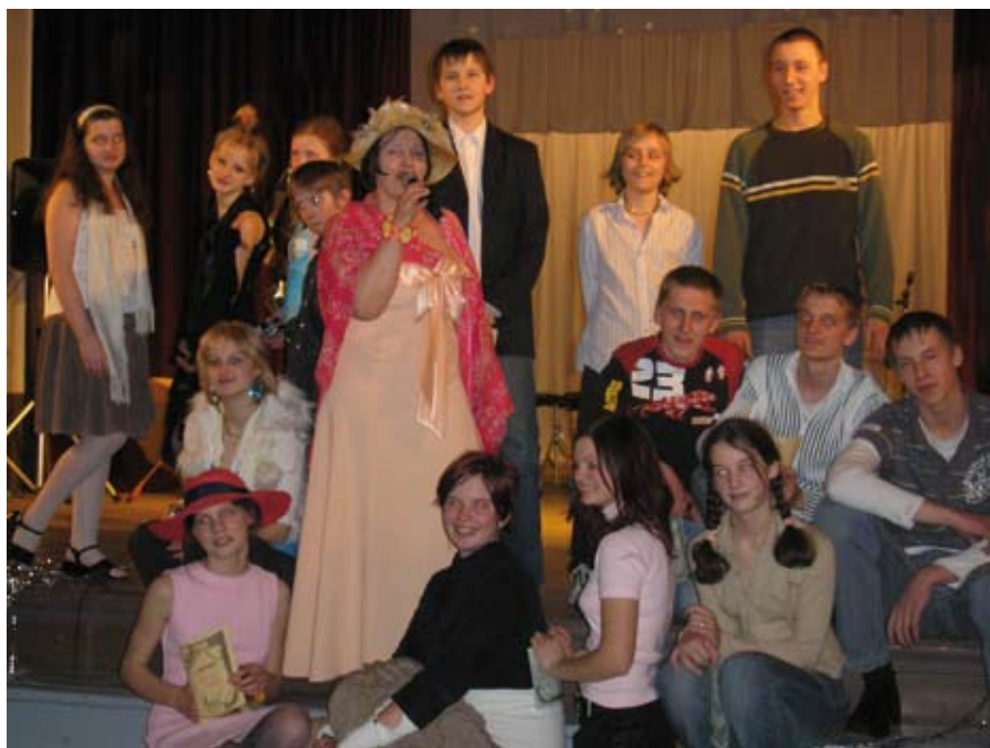
Ik gadus notiek jauno talantņu konkurss "la, si, da"